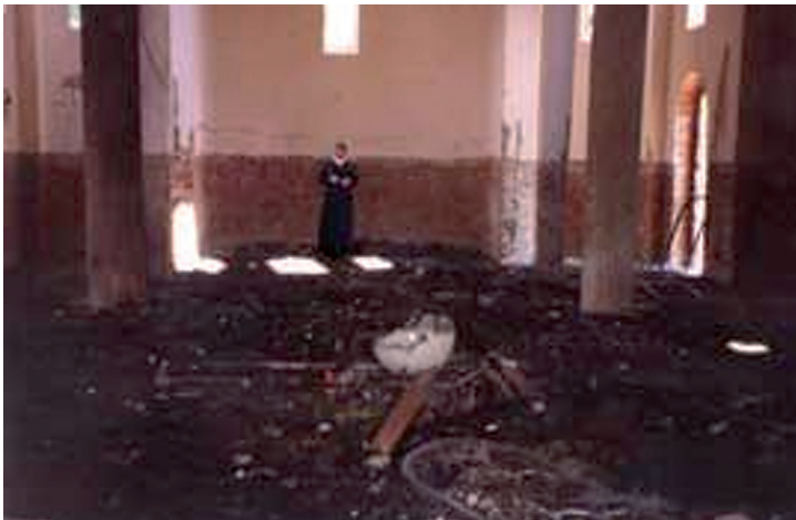
Унутрашњост оскрнављеног храма средином јуна 1999. године