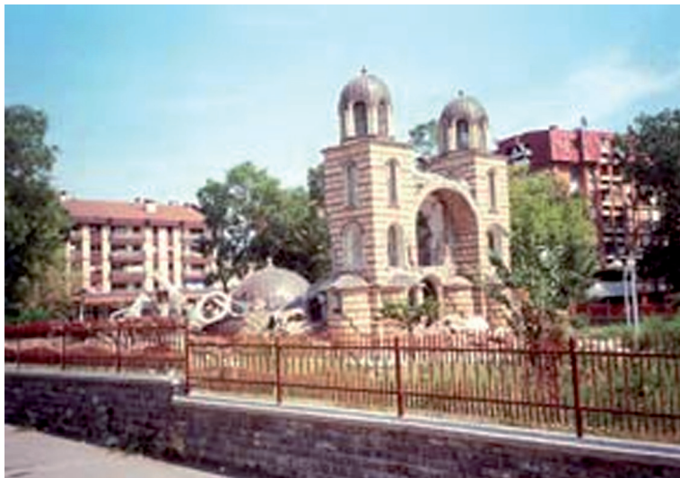
Изглед храма након минарања у ноћи 24/25. јула 1999. године

Услед чврстоће градње црква је рушена две године уз обилато коришћење динамита („дневно по педесет мина пуца“) и у томе су, под присилом и надзором милиције, учествовали и неки Срби. 41 Резигнирани, по њима, због „млаког“ залагања Светог архијерејског синода СПЦ да се са уништавањем цркве прекине у једном од писама упућеним највишим црквеним органима истицали су да су се „надали да ће владика призренски, патријарх и Свети синод скинути капе и отрчати код друга Тита да спрече рушење“, очајно наглашавајући: „Ми од данас нећемо више вашег наређења слушати, нити честитке о празнике слати. Лепо комунисти кажу — ‘Свештеници народ varaју. Бежите од њих, јер шта ви помогоше’“. 42