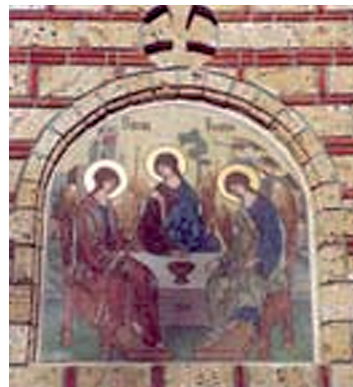
Мозаик „Свете Тројице“ изнад портала храма

неки начин камуфлирали, одбацујући од себе сваки приговор и сумњу, тобож да нису они изазвали, измислили су начин како да изврну право чињенично стање, на име, како је то српски народ тражио. (...) У Ђаковици имају муслимани 18 џамија и 12 текија, католици 2–3 цркве, а православни свега једну поменућу малу црквицу („Успења Свете Богородице“ — прим. В. Виријевић) величине 48,5м и ту недовршену цркву — спомен костурницу. Од времена ослобођења од Турака 1912. године па до данашњег дана, никоме није пало ни на ум да тражи рушење ма чије богомоље, до ето шта нам ти анационалисти учинише, представљајући се кобајаги комунистима који не трпе богомоље, до ни једну од својих, интересантно, не порушише, нити ма кад од ослобођења 1944. год. покушавају да то учине. Дату има аутономији Косовско-Метохијске области узели су врло погрешно и произвољно, као да су држава у држави, да им је све у моћи учинити штогод желе у корист својих националних послова“. 31