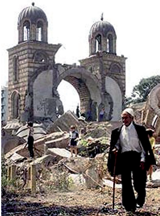
Остаци храма након „мартовског програма“ 2004. године

сваки пут све више кошта“, може се применити када се говори о судбини Ђаковичког храма „Свете тројице“. Наиме, протеривањем српског становништва из Ђаковице у лето 1999. године и доласком „мировних снага“ НАТО пакта (КФОР), храм се поново нашао на мети арбанашке рушилачке бестијалности. Одмах по доласку италијанских снага (као 1941. године), арбанашки екстремисти започели су са девастирањем унутрашњости храма, разбивши у парампарчад мозаик „Свете тројице“. Зидови су оскрнављени изметом, вулгарним натписима и паролама тзв. Ослободилачке војске Косова (ОВК), а након неколико дана црква је запаљена, иако су се италијански војници утаборили на свега 50 метара од ње.