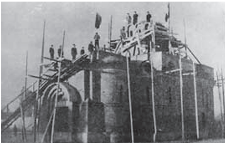
Изградња храма „Свете Тројице“ крајем 30-их година XX века

Радови су трајали четири године. Међутим, избијањем Априлског рата 1941. године и окупацијом југословенског државног простора морали су бити обустављени. До тада је здање храма било довршено „у грубим радовима“, покривено оловним плочама, а на врху звоника уграђен је златни крст. 26 Према изјави почившег патријарха Српске православне цркве, Павла, из 1990. године, у времену до 6. априла 1941. године део костију српских и црногорских ратника сахрањених у околини Ђаковице био је пренешен у крипту храма. 27