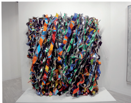
сл. 4. https://www.google.rs/john chamberlain (посећено 17. фебруара 2014.)

У том контексту, вредно је поменути и савременог српског аутора Владу Ранчића који је 90. тих година, реагујући на НАТО агресију у нашој земљи, од деформисаних и перфорираних лимова новосадске рафинерије, начинио инпресивну инсталацију. Иначе Ранчић и данас указује на феномен деструкције и зла у свету. 19 Са друге стране, уметност Ђорђа Станојевића враћа човека свом исконском реду и поретку — враћа га земљи. Отуда овај уметник инсистира на једној корелацији онога што човек јесте, дакле земља , и покушава да на сликарско платно као у земљу утисне емоцију. Отуда он прави бразде на својим сликама а саму земљу користи уместо боје. Земља, како тврди Ђорђе као медијум има огромну снагу, она у себи носи историју, психологију и егзистенцијалност одређеној конкретной простора . 20 Уметник у овом случају жели да приђе земљи што ближе, при том не користећи се класичним сликарским алатом, или то чинећи у најмање могућој мери. Он слика рукама, скупља земљу и лепи је у рамове, користећи, јод, плеву, метал и дрво, просто комуницира са земљом. Као да жели да је оплемени и да се од ње оплемени, што све потврђује тезу овога рада — да је уметност у дубоком смислу везана за Литургију и да је сама својеврсна доксологија Творцу. (сл. 5) Ако земља памти онда је једино блаженство за њу управо у поштовању оних плодова и дарова које нам она нуди, али човеку се пружа прилика да ту напаћену и намучену земљу осветла, да прво постане свестан да је и сам део ње а затим да је принесе небу.