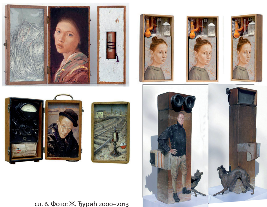
сл. 6.