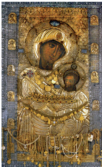
сл. 8. Пαναγία портаџтиса (посећено 17. фебруара 2014.)

настира на којој видимо поред окова мноштво драгог камења, 24 или рецимо Света Варвара из Лондона која је прави облик асамбља (сл. 7). 25 Многе иконе се, поред кандила ките и цвећем што све представља грађење једне уметничко — народне композиције која настаје, има карактер недовршивости. Такав пример су наравно иконостаси, сами по себи они чине један спој разнородних њредмеџа . Ту је носећи део, често у камену или дрвету резбарен и украшаван, затим саме иконе, и најзад разни други предмети, кандила, свеће и друго. У Светој гори је и дан данас присутно мноштво свећа на богато украшеним полијелејима. Но поред свећа и кандила сусрећемо иконе и нојева јаја. Свакако да је најзначајније то што до дан данас, постоји мноштво чудотворних икона од којих би могла да се помене рецимо икона Портаитиса (Портаџтиса) из манастира Ивирона која, као и наша Тројеручица носи мноштво драгуља, ланчића. (сл. 8). 26